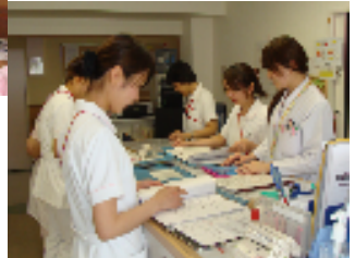
看護スタッフとミーティング