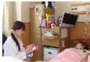
入院患者への服薬指導